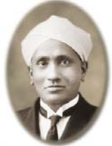
Chandrasekhar Venkata Raman (1888-1970)